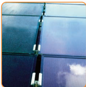
VORHER | NACHHER

Verhindern Sie das Einbrennen von Schmutz und Tensiden durch regelmäßige Reinigung. Sichern auch Sie sich die Vorteile unserer professionellen und umweltfreundlichen Reinigung: